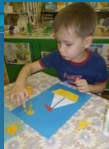
Аппликация с элементами рисования «Плывет кораблик по волнам»