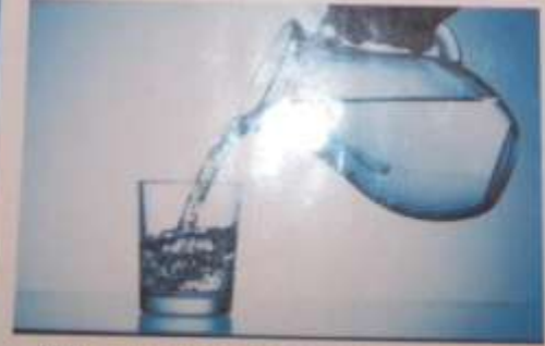
Вода жидкая, льётся и принимает форму сосуда