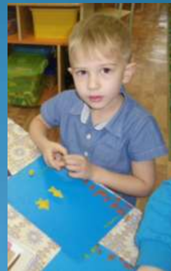
Пластилинография «Морской мир»