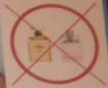
Вода не имеет запаха