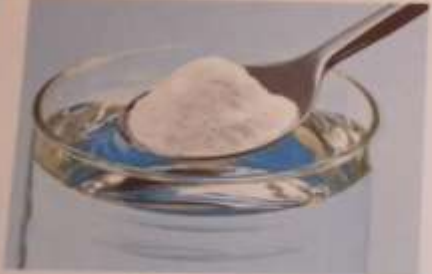
Вода - растворитель