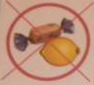
Вода не имеет вкуса