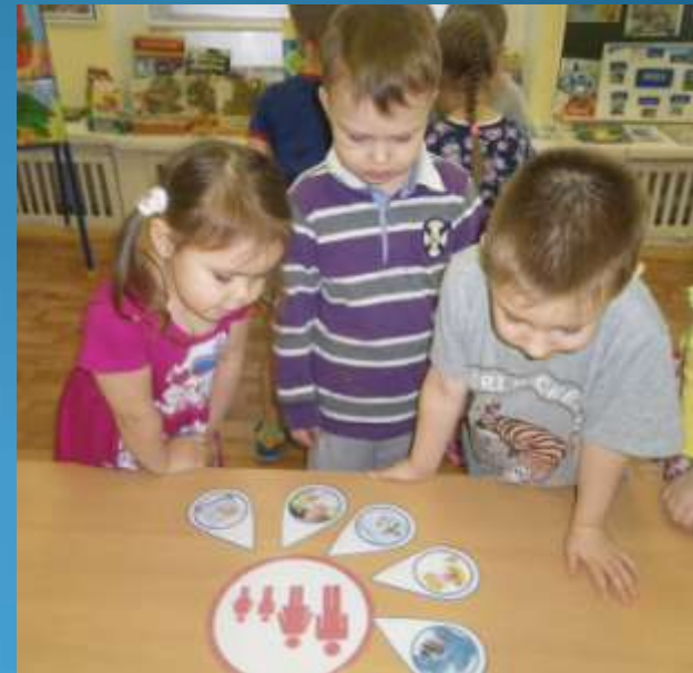
Дидактическая игра «Всем нужна вода»