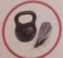
Вода имеет вес