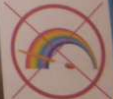
Вода прозрачная, не имеет цвета